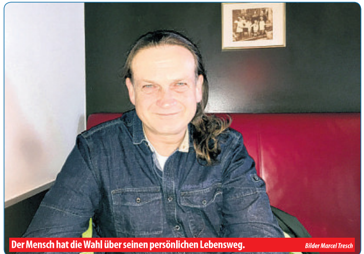
Der Mensch hat die Wahl über seinen persönlichen Lebensweg.